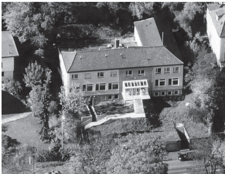
K.St.V. Normannia, Mergentheimer Straße 50, Würzburg